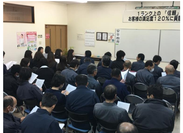
総勢 59 名の参加