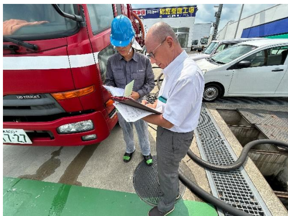
(株)群桐産業 作業立会審査（分離槽清掃）