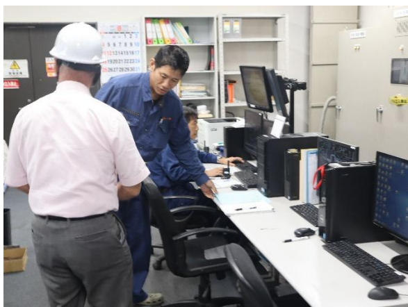
群桐エコロ(株) サイトツアー（新田工場）