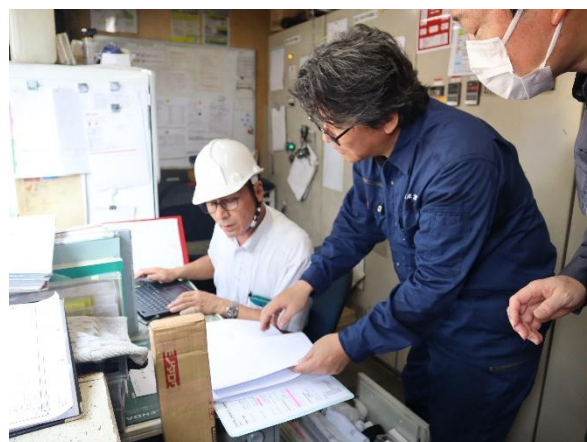
(株)群桐産業 サイトツアー（藪塚工場）