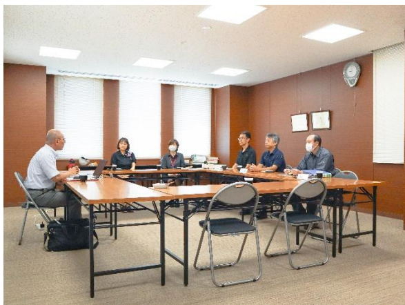
オープニングミーティング

8月5日～7日の3日間、群桐グループではISO14001 認証審査機関（SGS ジャパン株式会社）による維持審査が実施されました。期間中は審査員1名が、(株)群桐産業と群桐エコロ(株)をそれぞれ訪れ、書類審査や社員インタビューや現場確認などを行いました。不適合は0件、肯定的観察事項が2件、改善の機会が3件という内容で問題無く終了いたしました。