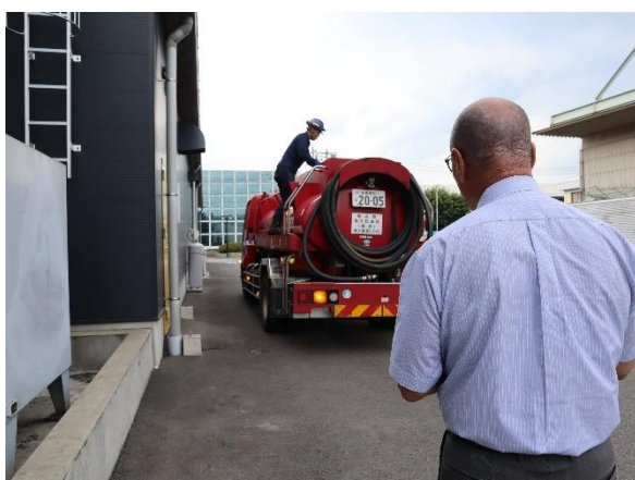
(株)群桐産業 作業立会審査（再生重油配送）